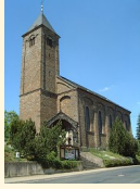
St. Bartholomäus Boos