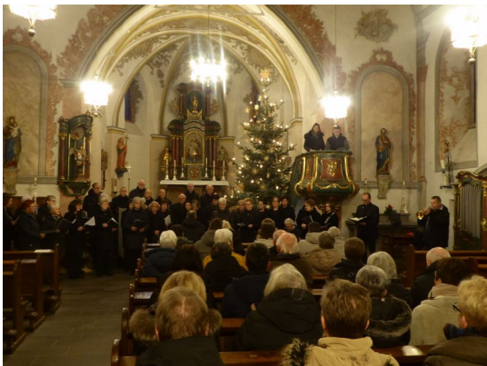
Weihnachtskantate mit dem Nachtsheimer Chor in Alfien – Text siehe Pfarrei Nachtsheim