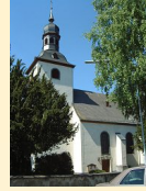
St. Kastor Weiler