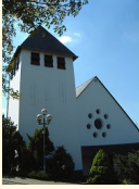
St. Dionysius Bermel