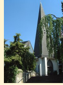
St. Stephan Nachtsheim