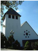
St. Dionysius Bernel