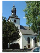
St. Kastor Weiler