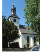
St. Kastor Weiler