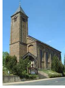
St. Bartholomäus Boos