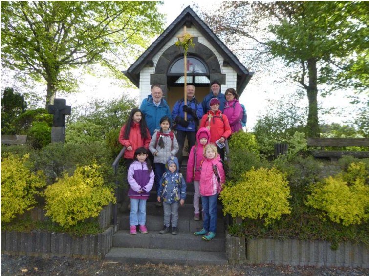
Statio an der Laubacher Kapelle