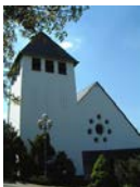
St. Dionysius Bernel