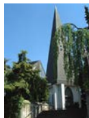
St. Stephanus Nachtsheim