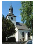
St. Kastor Weiler