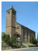
St. Bartholomäus Boos