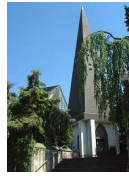
St. Stephanus Nachtsheim