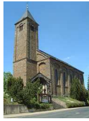
St. Bartholomäus Boos