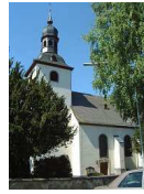
St. Kastor Weiler